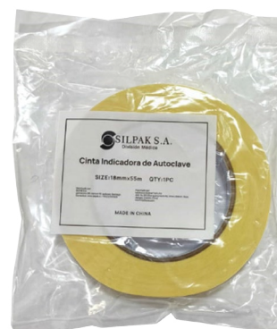
Cinta SILPAK esterilización a vapor 18 mm x 55 mt caja unidad ID 2229922