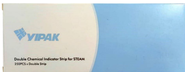
Cinta esterilización YIPAK Tira Multiparámetro 20 x 15 cm caja 250 unidades ID 2229947